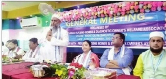
বারুইপুরে নার্সিংহোম অ্যাসোসিয়েশনের রাজ্যস্তরের সভায় বিশিষ্টরা।